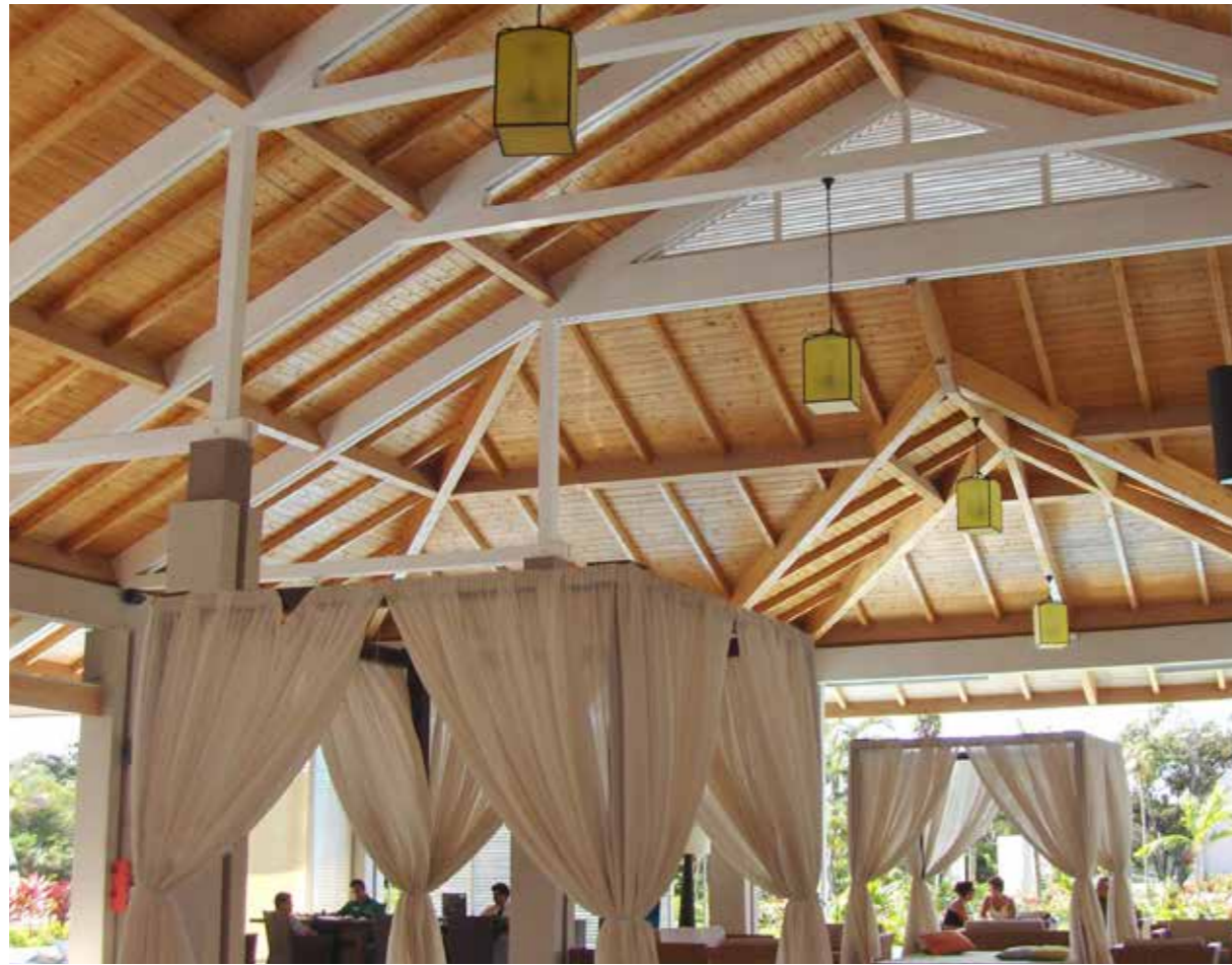
Lobby - Hotel Playa - Cayo S. Maria - Cuba