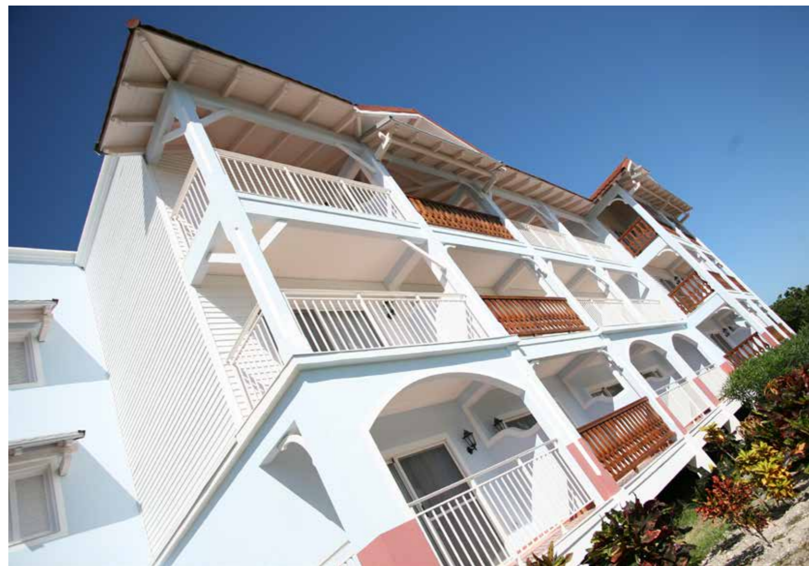
Bungalows - Remedios Hotel Barcelò - Cayo S. María - Cuba