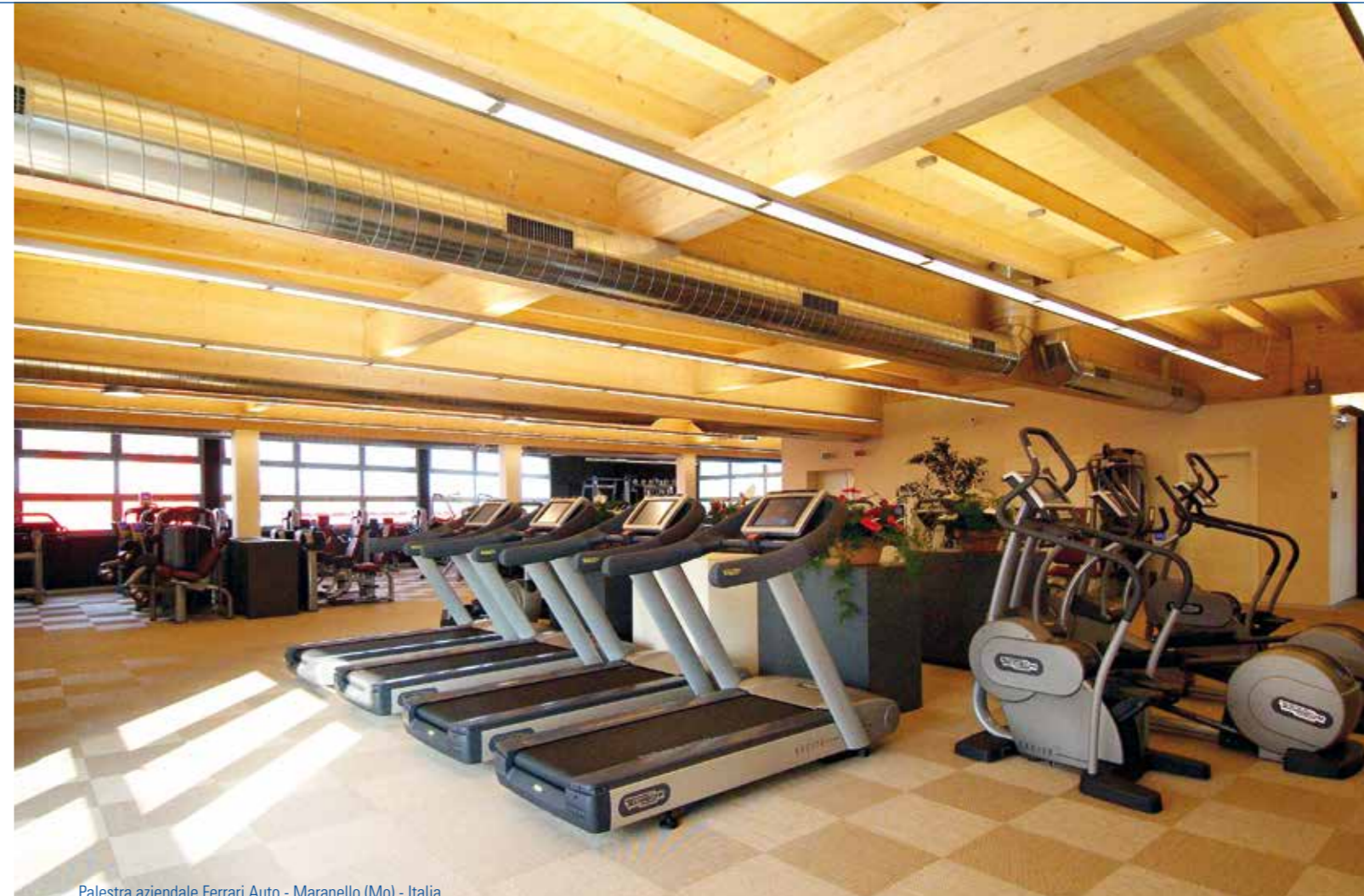
Palestra aziendale Ferrari Auto - Maranello (Mo) - Italia