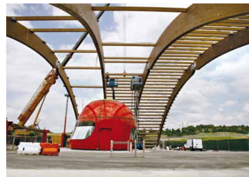
Entrada circuito de carreras Mugello - Mugello (Fi) - Italia