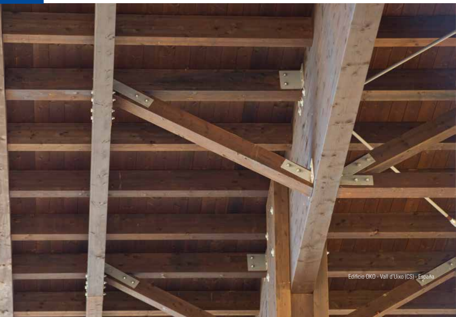
Edificio OKO - Vall d'Uixo (CS) - España