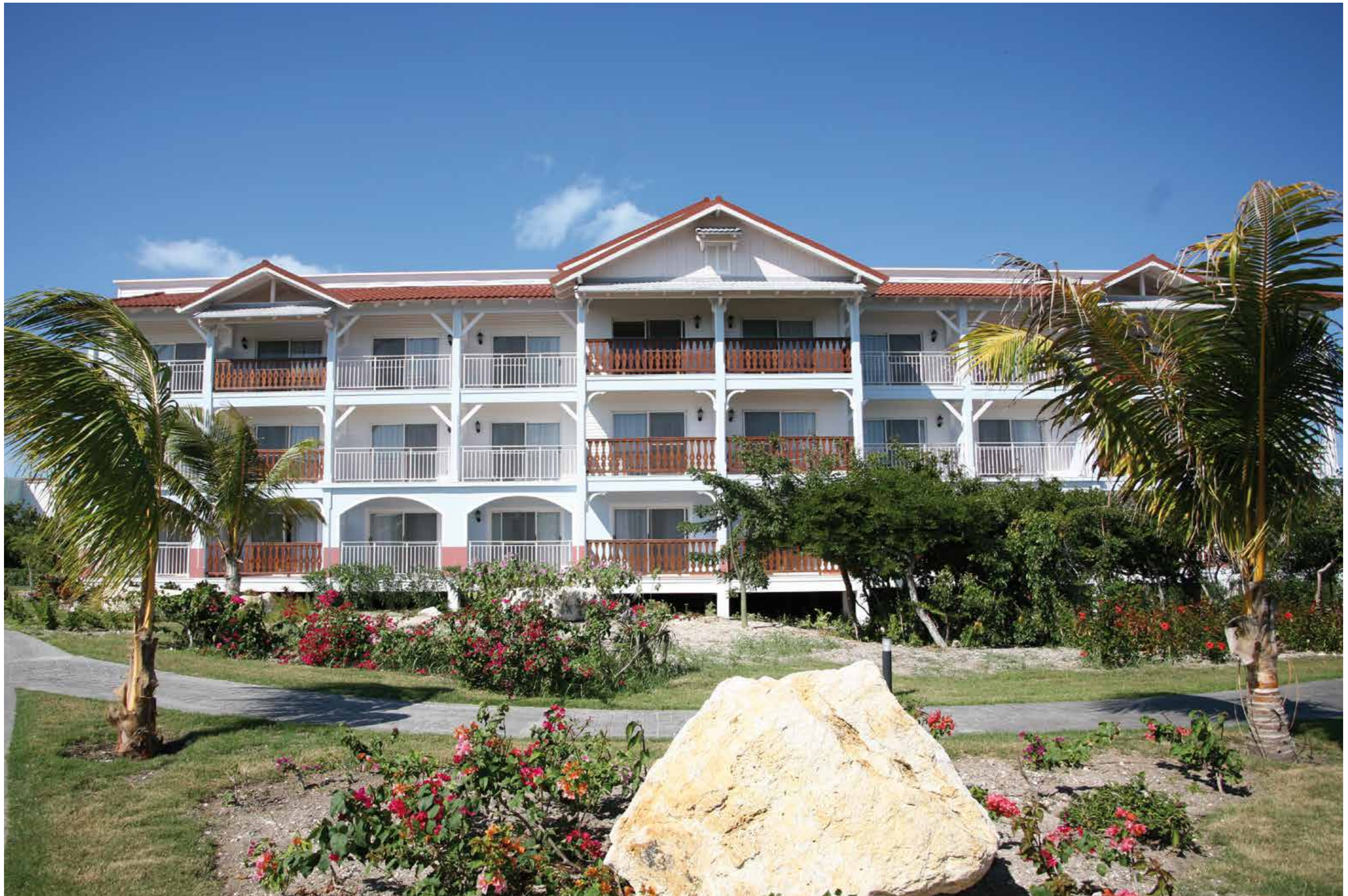
Bungalow Remedios - Hotel Barcelò - Cayo S. Maria - Cuba