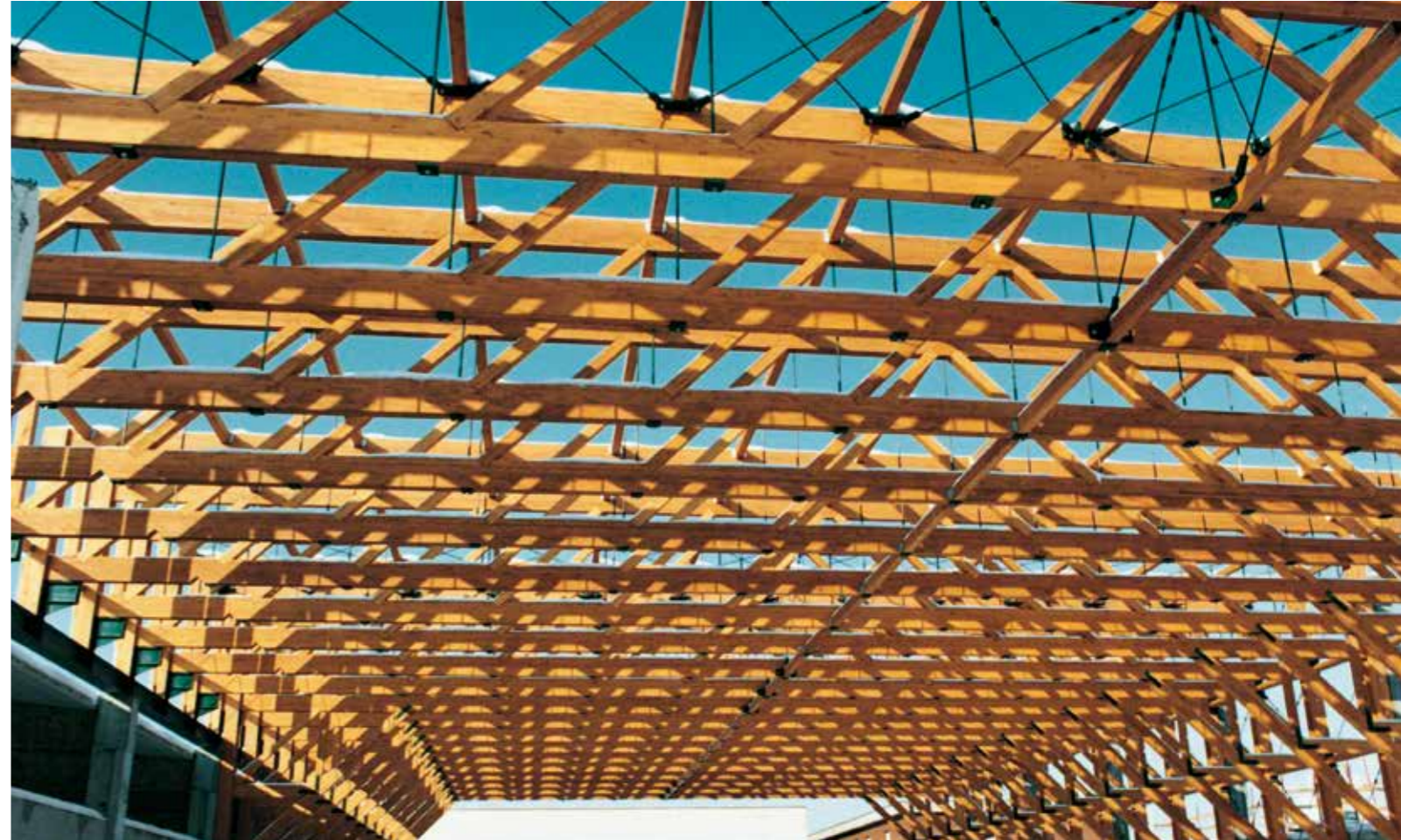
Bocciodromo - Maranello (Mo) - Italia