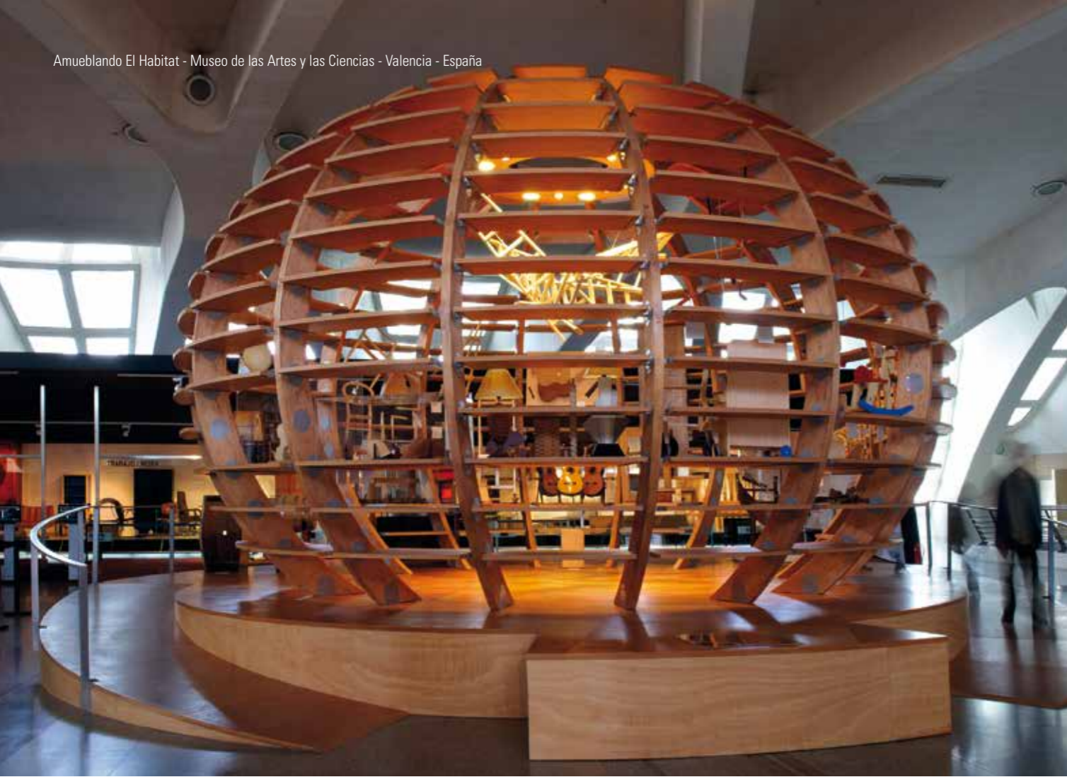
Amueblando El Habitat - Museo de las Artes y las Ciencias - Valencia - España