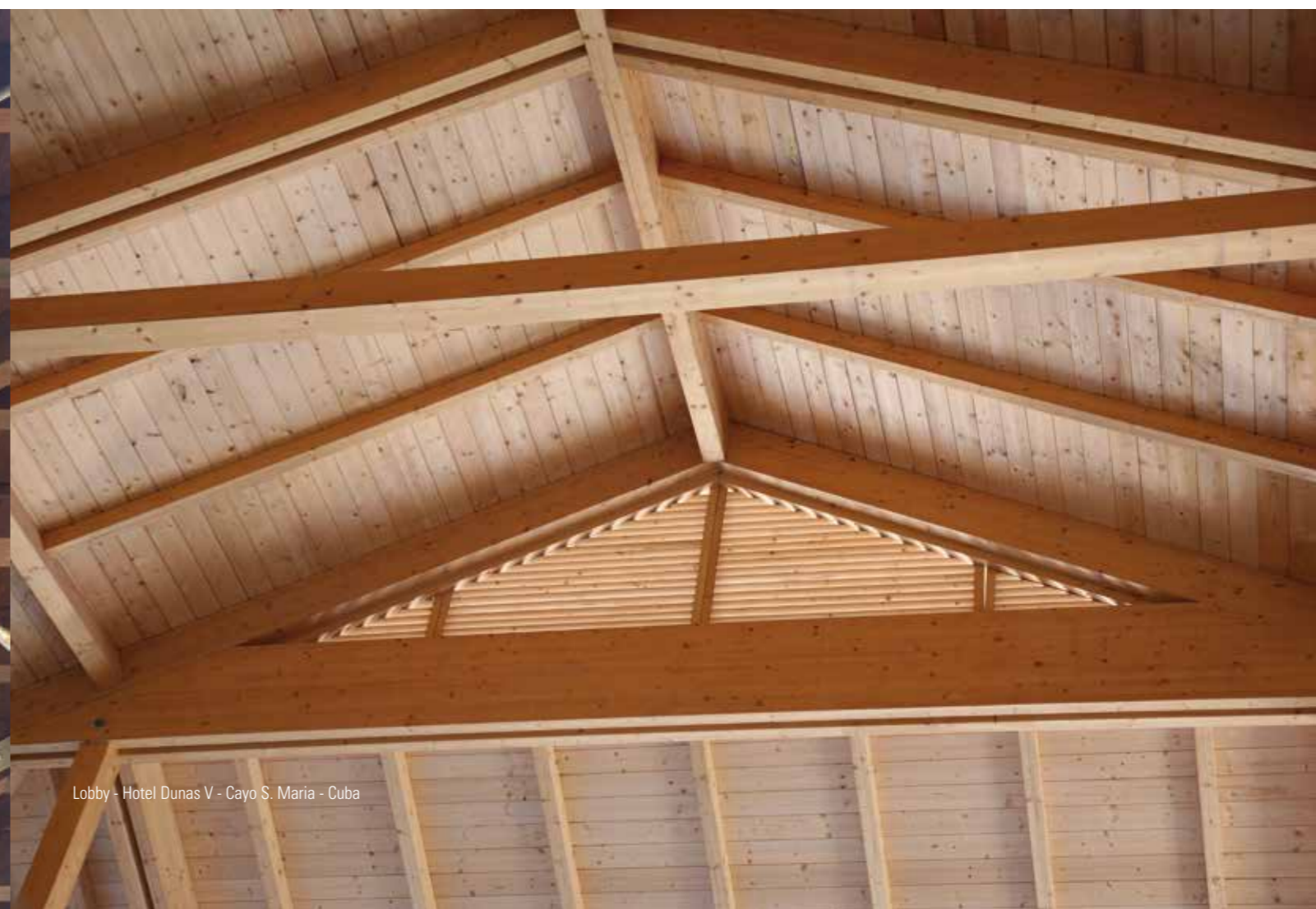
Lobby - Hotel Dunas V - Cayo S. Maria - Cuba