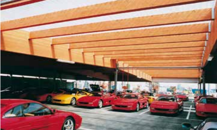
Stabilimento Ferrari Auto - Maranello (Mo) - Italia

Q ué mejor que presentar lo realizado para demostrar las aptitudes de cada uno. Sistem Costruzioni puede ofrecer ejemplos de las más diversas clases de obras: grandes estructuras, viviendas, puentes, estructuras ligeras, casas prefabricadas y edificios de la línea Natura. A continuación, como ejemplo, se ilustran varias obras efectuadas por Sistem.