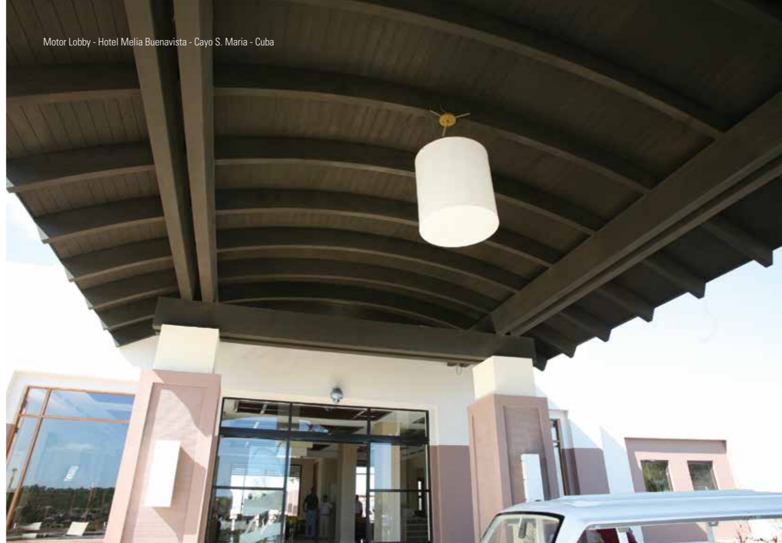
Motor Lobby - Hotel Melia Buenavista - Cayo S. Maria - Cuba

R ien de mieux que nos réalisations pour prouver nos capacités. Sistem Costruzioni a des exemples pour tous les goûts : des grandes structures, des infrastructures résidentielles, des ponts, des structures légères, des maisons préfabriquées et les bâtiments de la ligne Natura. Ci-après quelques exemples des ouvrages Sistem.