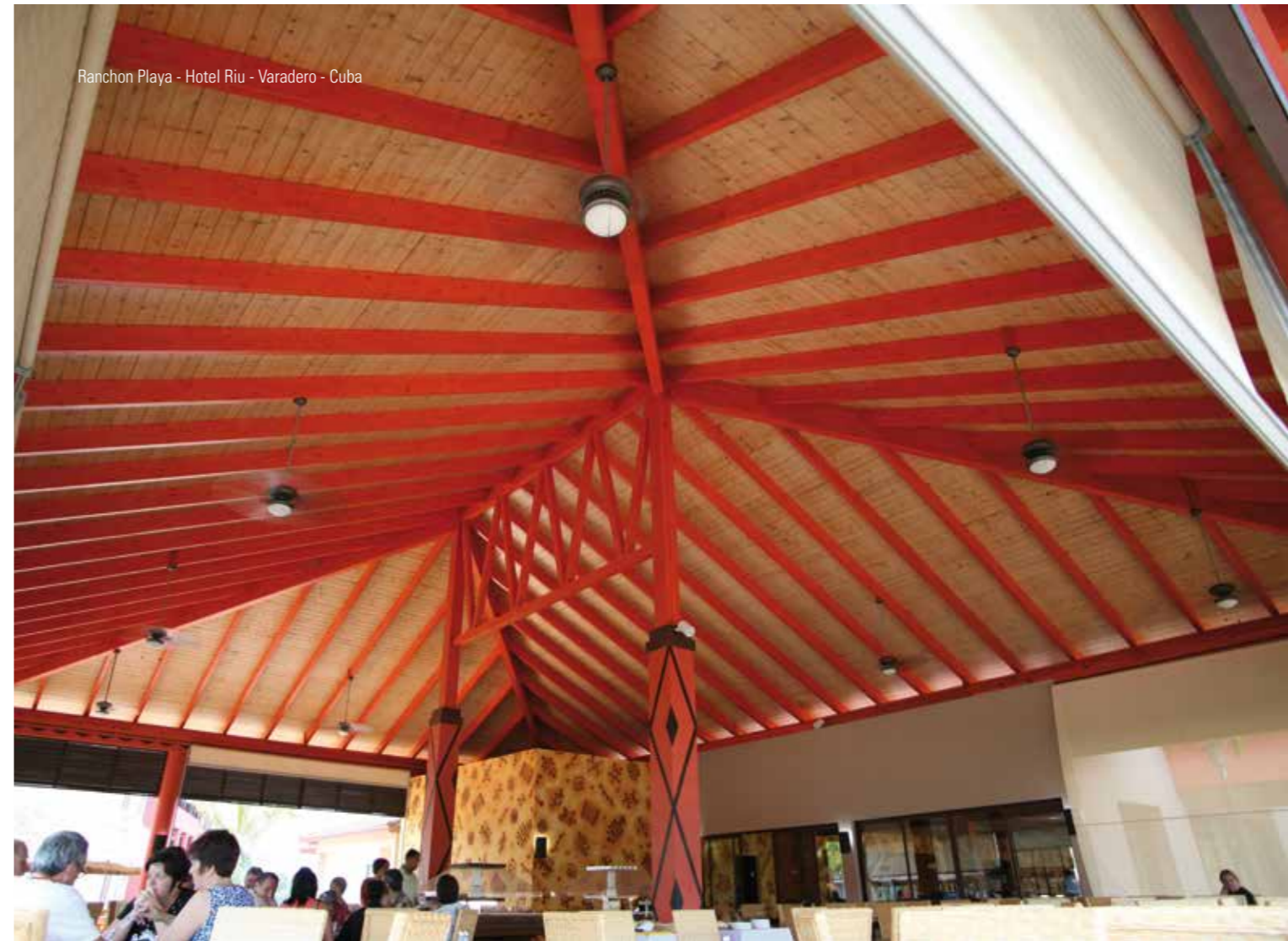
Ranchon Playa - Hotel Riu - Varadero - Cuba