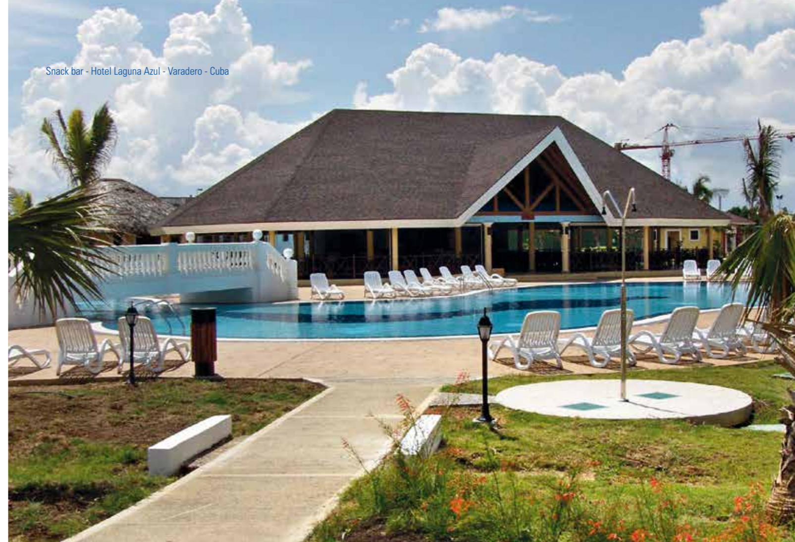
Snack bar - Hotel Laguna Azul - Varadero - Cuba

Cuando las estructuras no están a la intemperie, como en el caso de las coberturas, no resulta necesario mantenimiento alguno. En lo que concierne a obras en el exterior, como por ejemplo los puentes, el plan de mantenimiento es muy sencillo y económico.