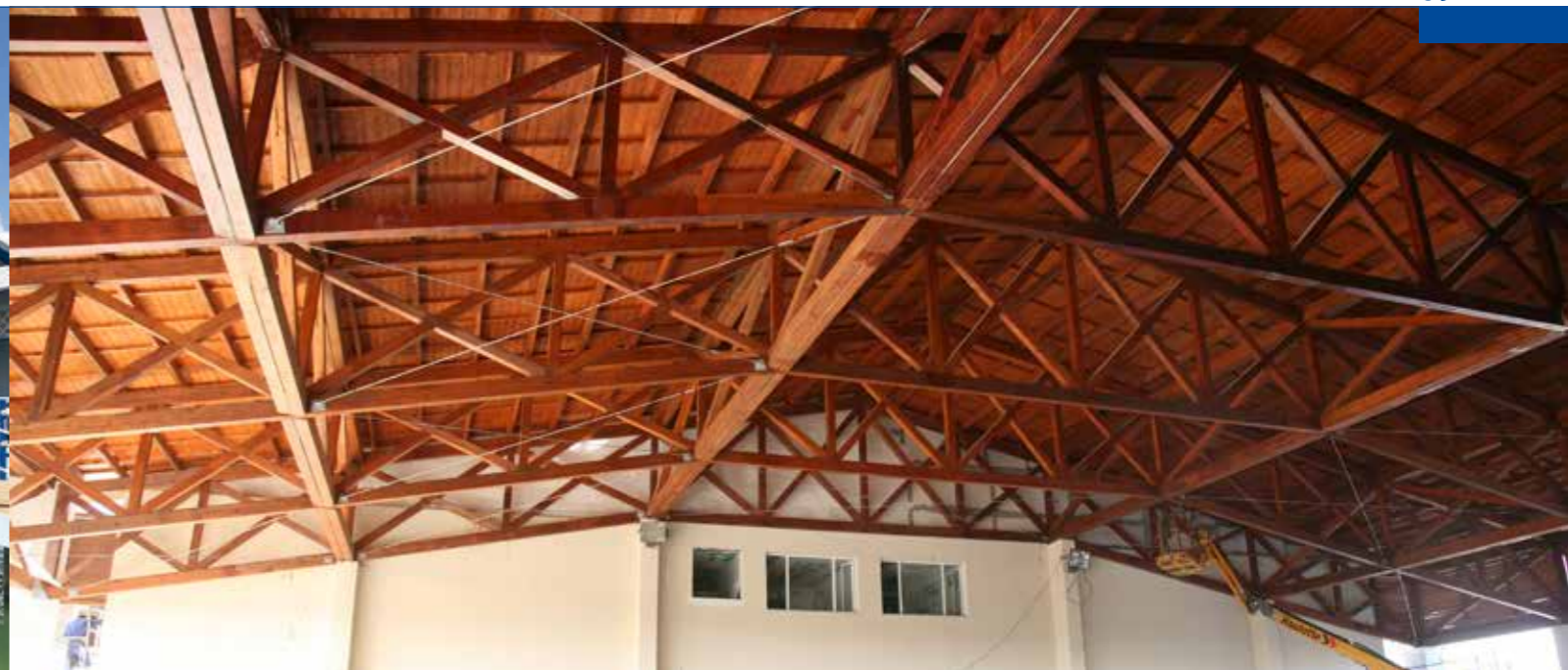
Club Mediterranée - Varadero - Cuba