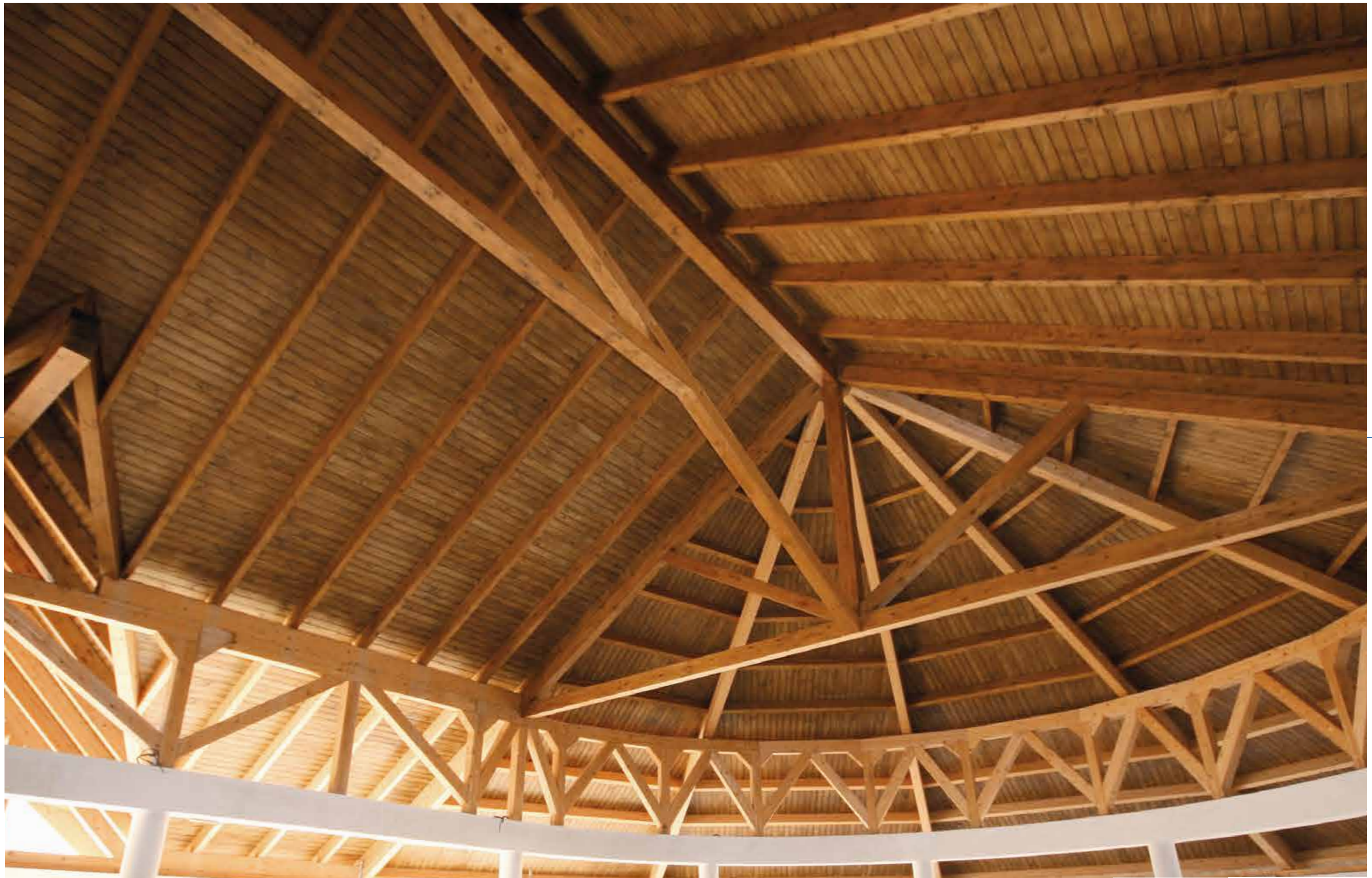
Snack bar - Hotel Laguna Azul - Varadero - Cuba