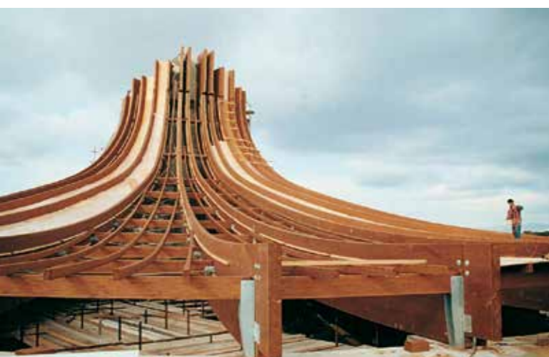
Chiesa - S.Felice Circeo (Lt) - Italia

La técnica de la madera laminada prevé que las láminas secadas a altas temperaturas sean seleccionadas cualitativamente, cepilladas y unidas por testa hasta conseguir travesaños de la longitud requerida; a continuación pasan por la encoladora de cortina y finalmente por la prensa hidráulica, que da al travesaño o viga laminada la forma y el tamaño requeridos. Las vigas creadas de este modo pasan al área de elaboración, donde son cortadas, perfiladas y perforadas, para convertirse en elementos terminados listos para su instalación. La madera laminada, antes de dejar nuestro establecimiento, es sometida a un tratamiento con barnices impregnantes (que pueden ser de coloraciones diversas) para mejorar su resistencia frente a posibles ataques de parásitos o agentes atmosféricos, sin impedir que “respire” de manera natural. Esta filosofía de la empresa determina una continua labor de estudio e investigación para tratar de mejorar. La calidad no se logra avanzando a sacudidas, sino única y exclusivamente perseverando con tesón en el perfeccionamiento de cada detalle y poniendo en juego todos los recursos de la empresa en beneficio de un progreso constante. Trabajando de acuerdo con esta filosofía, precisamente, hemos llegado a Natura, un proyecto que constituye la máxima expresión de la oferta de Sistem Costruzioni en su empeño por aunar calidad y belleza.