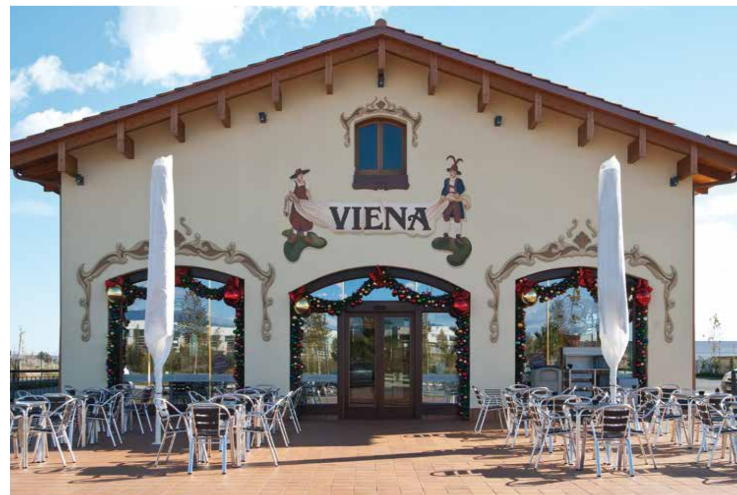
Restaurante Viena - Reus - España