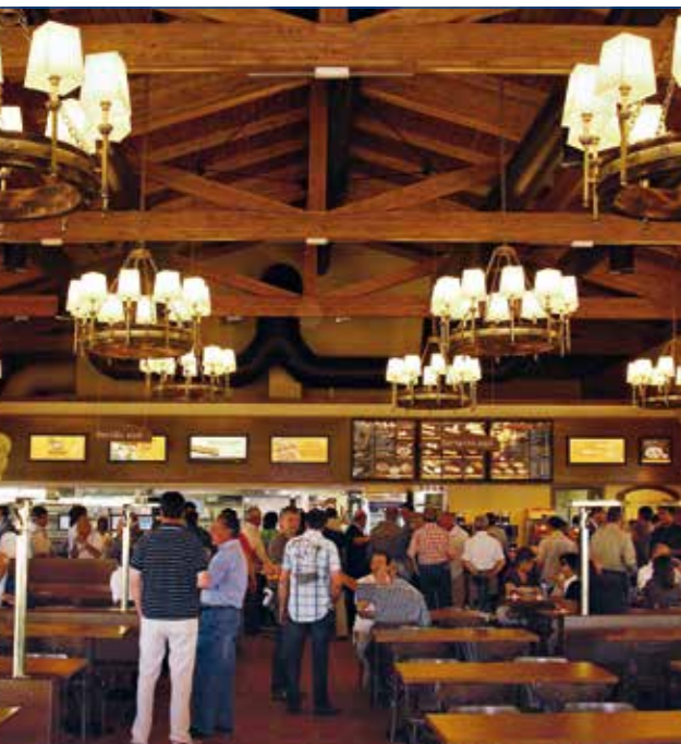
Restaurante Viena - Vic - España

SISTEM. UNA DIMENSIONE INTERNAZIONALE. SISTEM. UNE DIMENSION INTERNATIONALE.