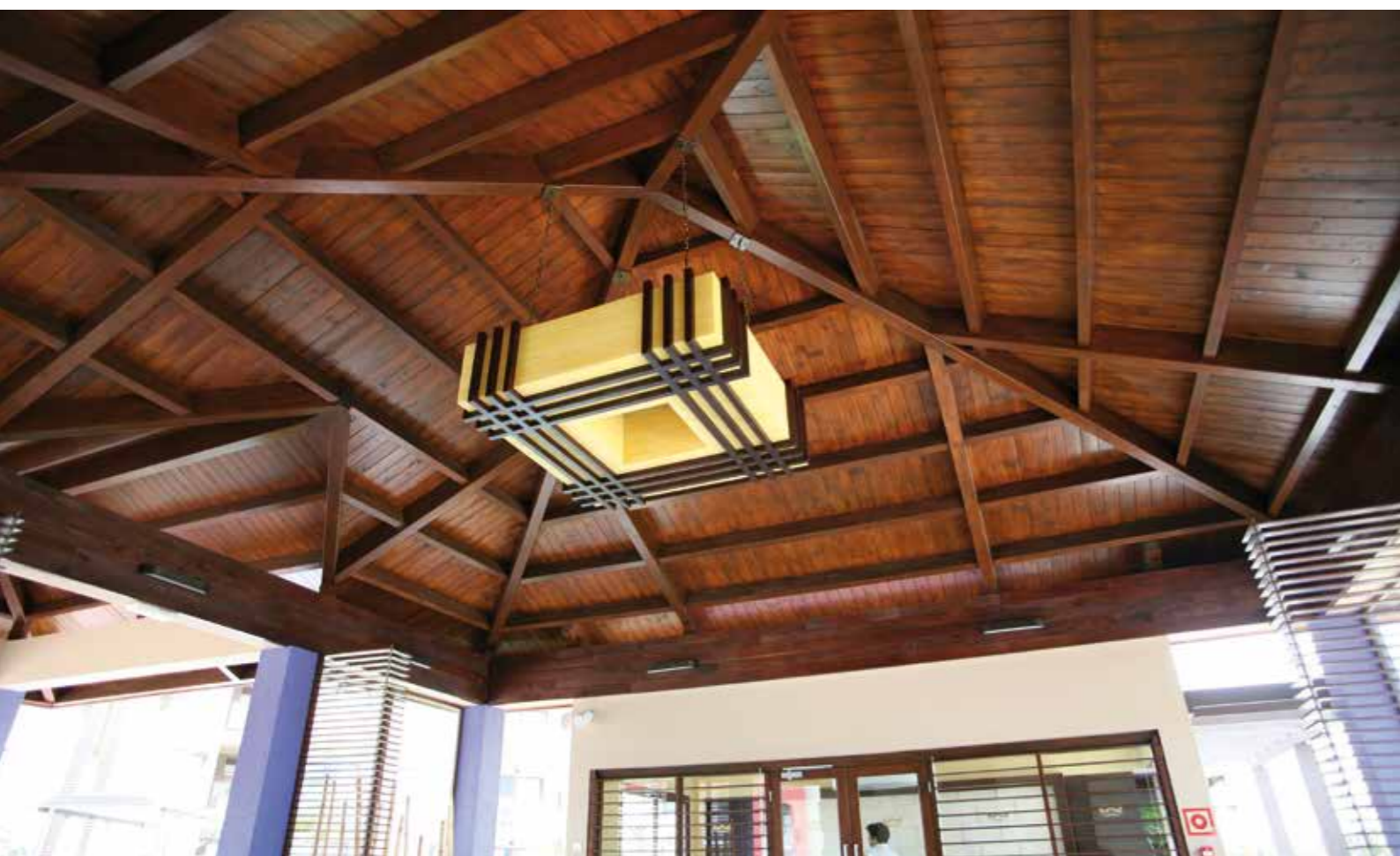
Recepcion planta Real - Hotel Riu - Varadero - Cuba