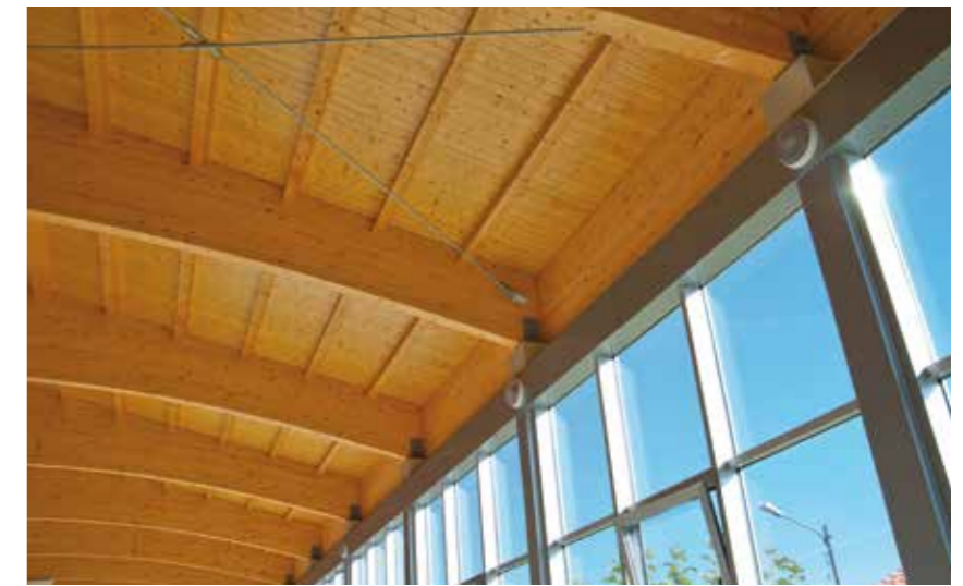
Museo de la Trufa - Sarion (CS) - España