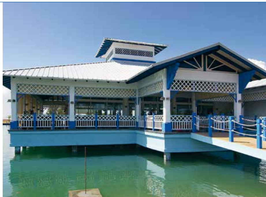
Restaurante "KiKe-Kcho" - Varadero - Cuba