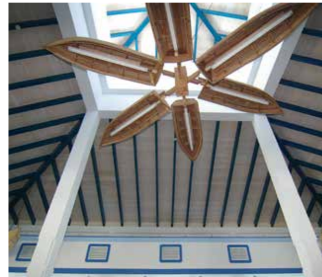
Restaurante KiKe Kcho - Varadero - Cuba