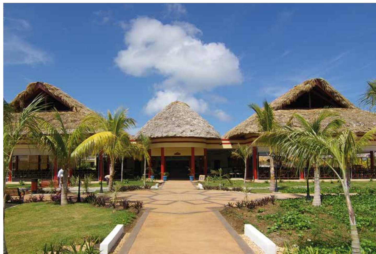
Ranchon Playa - Hotel Laguna Azul - Varadero - Cuba