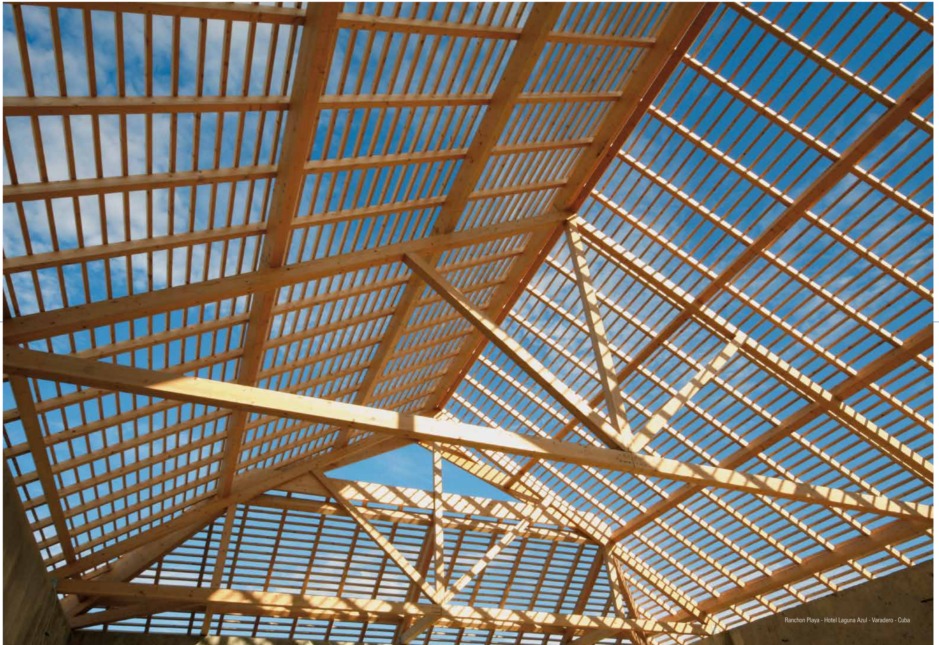
Rancho Playa - Hotel Laguna Azul - Varadero - Cuba