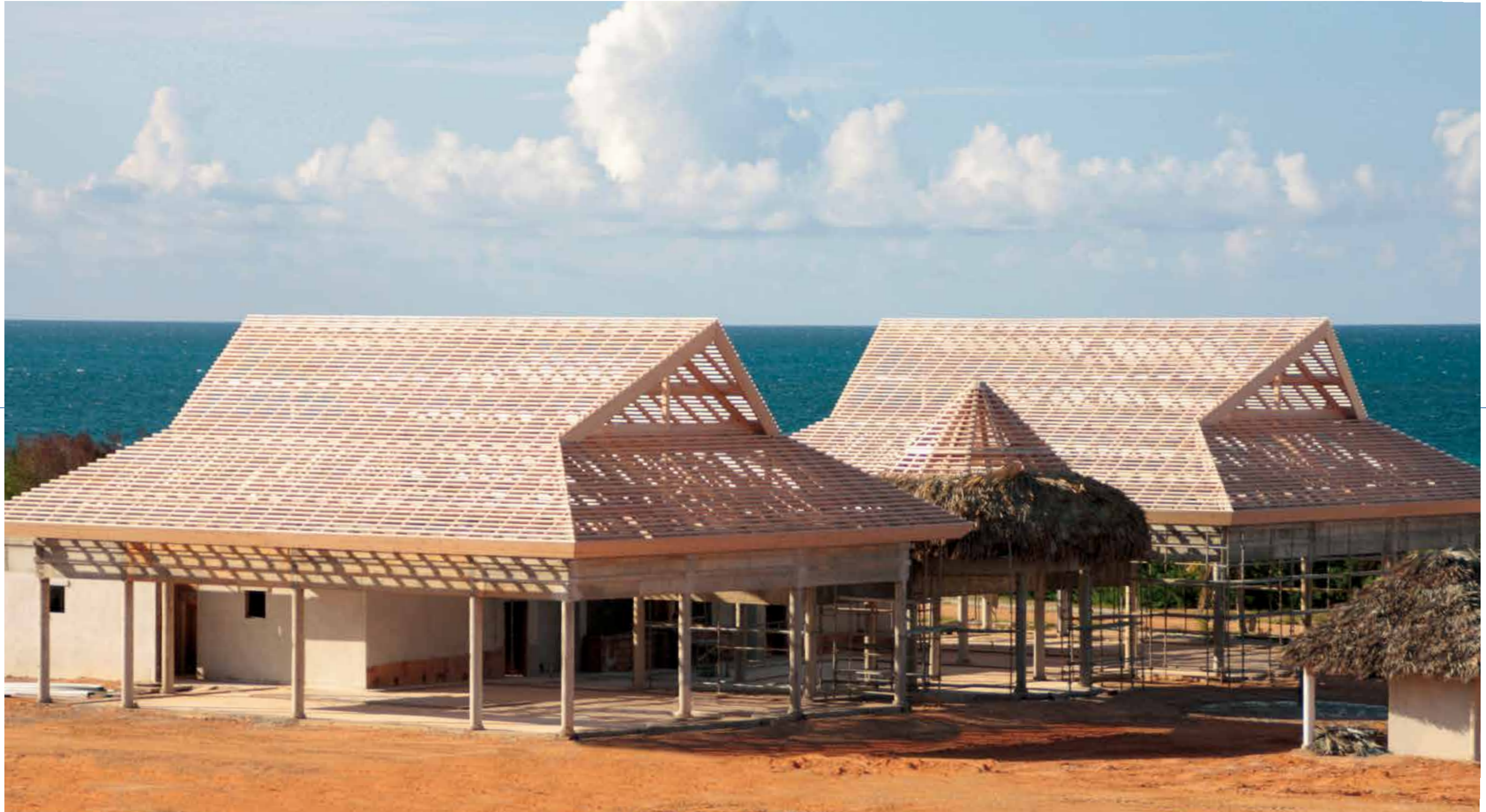
Rancho Playa - Hotel Laguna Azul - Varadero - Cuba