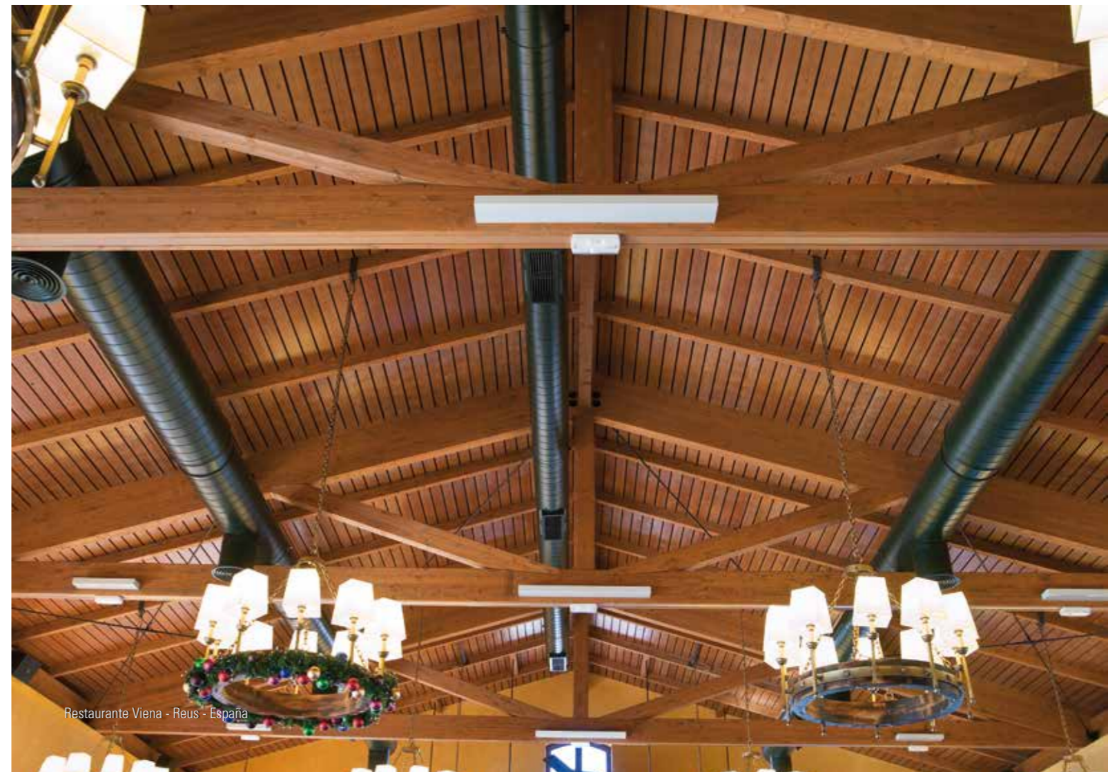
Restaurante Viena - Reus - España

Si les structures ne sont pas exposées aux caprices du temps, comme pour les couvertures, aucune maintenance n'est nécessaire. Pour les ouvrages extérieurs, comme les ponts par exemple, la manutention est très simple et économique.