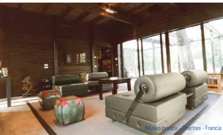
Museo privato - Chartres - Francia

Selon la technique du bois lamellé, les lamelles séchées à haute température sont d'abord soumises à un tri de qualité, puis dressées et aboutées pour obtenir la longueur des poutres. Elles passent ensuite sous l'encolleuse rideau et, finalement, dans la presse hydraulique qui donne au lamellé la forme et la taille souhaitées. Les poutres se retrouvent alors dans l'atelier, où elles sont découpées, façonnées et percées pour en faire des éléments finis et prêts à poser. Avant de quitter l'usine, le bois lamellé est traité avec des agents d'imprégnation colorés qui renforcent sa résistance aux parasites et aux agents atmosphériques, sans toutefois compromettre sa « respiration » naturelle.