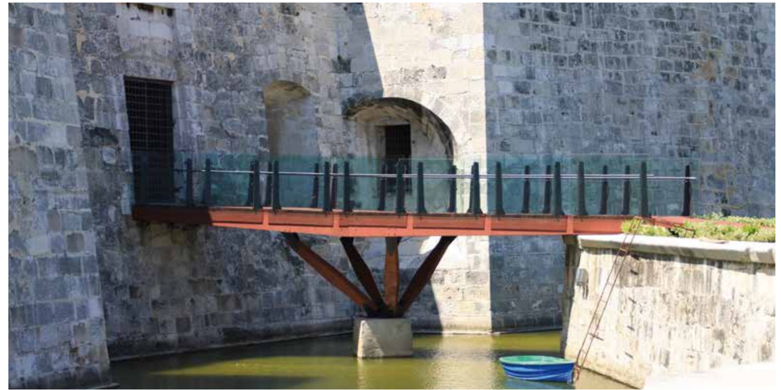
Puente peatonal - Castillo de la Real Fuerza - La Habana - Cuba