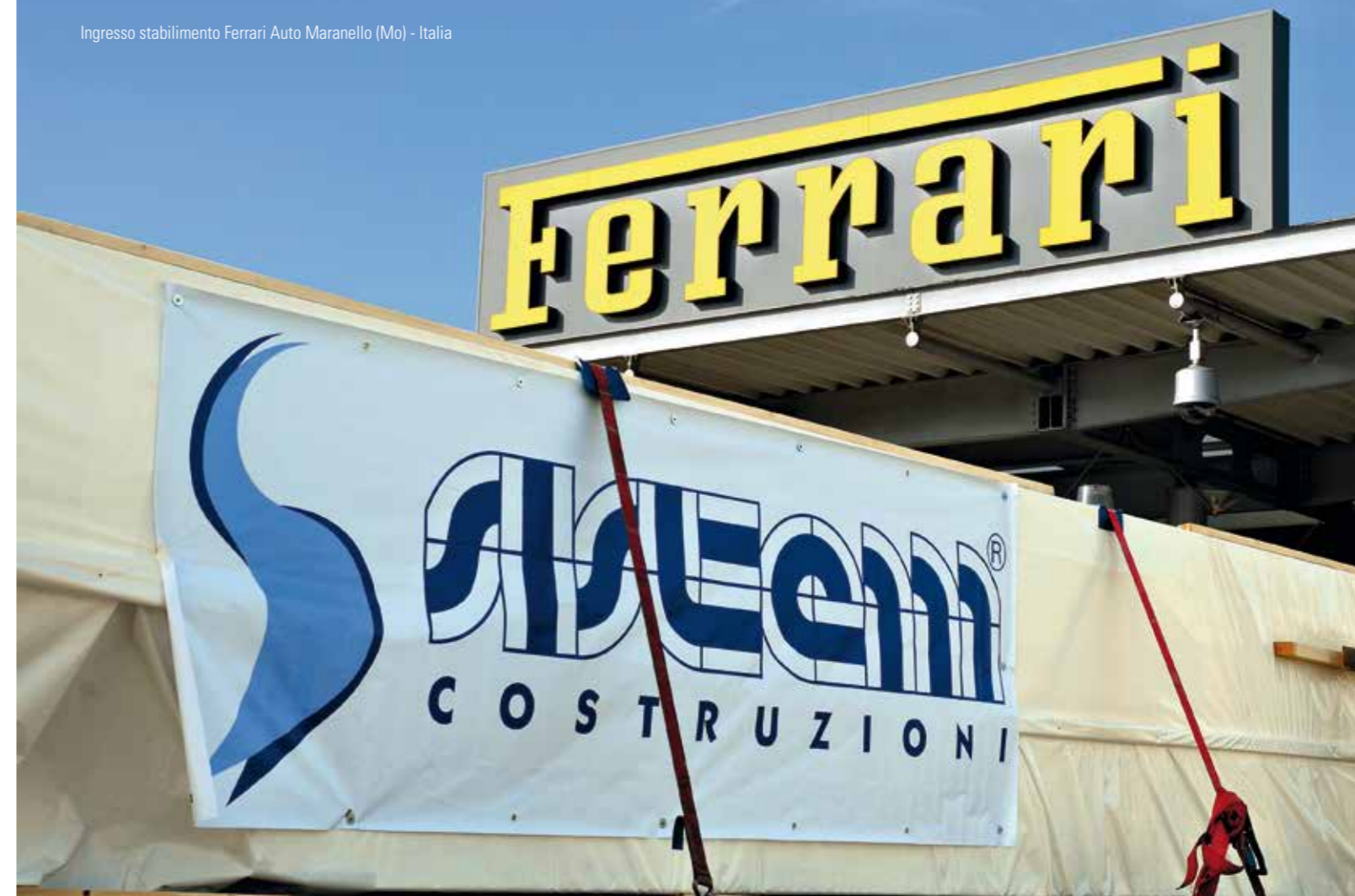
Ingresso stabilimento Ferrari Auto Maranello (Mo) - Italia

Si le client en fait la demande, Sistem Costruzioni s'occupe aussi des gros-œuvres et des systèmes technologiques pour lui remettre un travail complet. Avec ses bureaux commerciaux et ses centres d'assistance technique implantés un peu partout en Italie (consulter le site www.sistem.it ), Sistem Costruzioni peut affronter et résoudre toutes les exigences liées à la construction. De plus, l'entreprise fournit des devis très précis avant la signature du contrat.